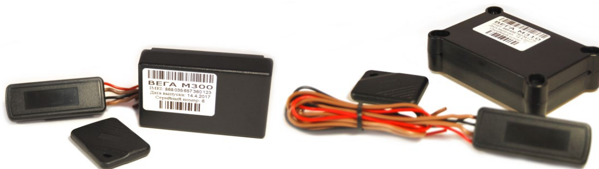
Рисунок 2 - Внешний вид и комплект поставки поискового устройства Вега М300 (слева) и Вега М310 (справа).