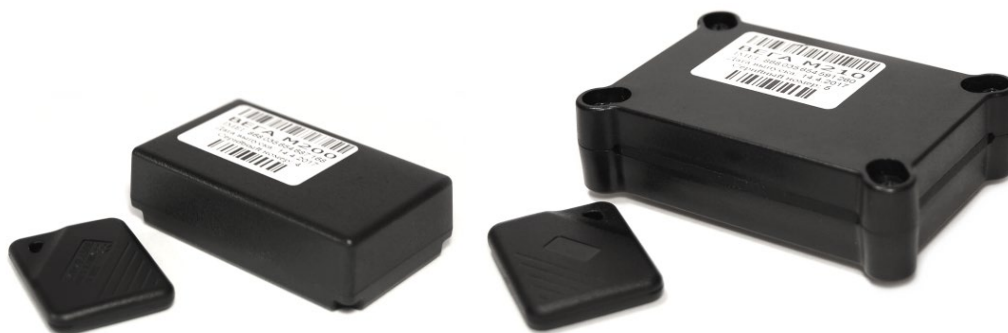
Рисунок 1 - Внешний вид и комплект поставки поискового устройства Вега М200 (слева) и Вега М210 (справа).

При использовании устройства с заводскими настройками продолжительность автономной работы может составлять до 2-х лет.